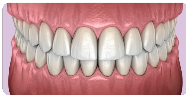
Dents soignées suite au détartrage.